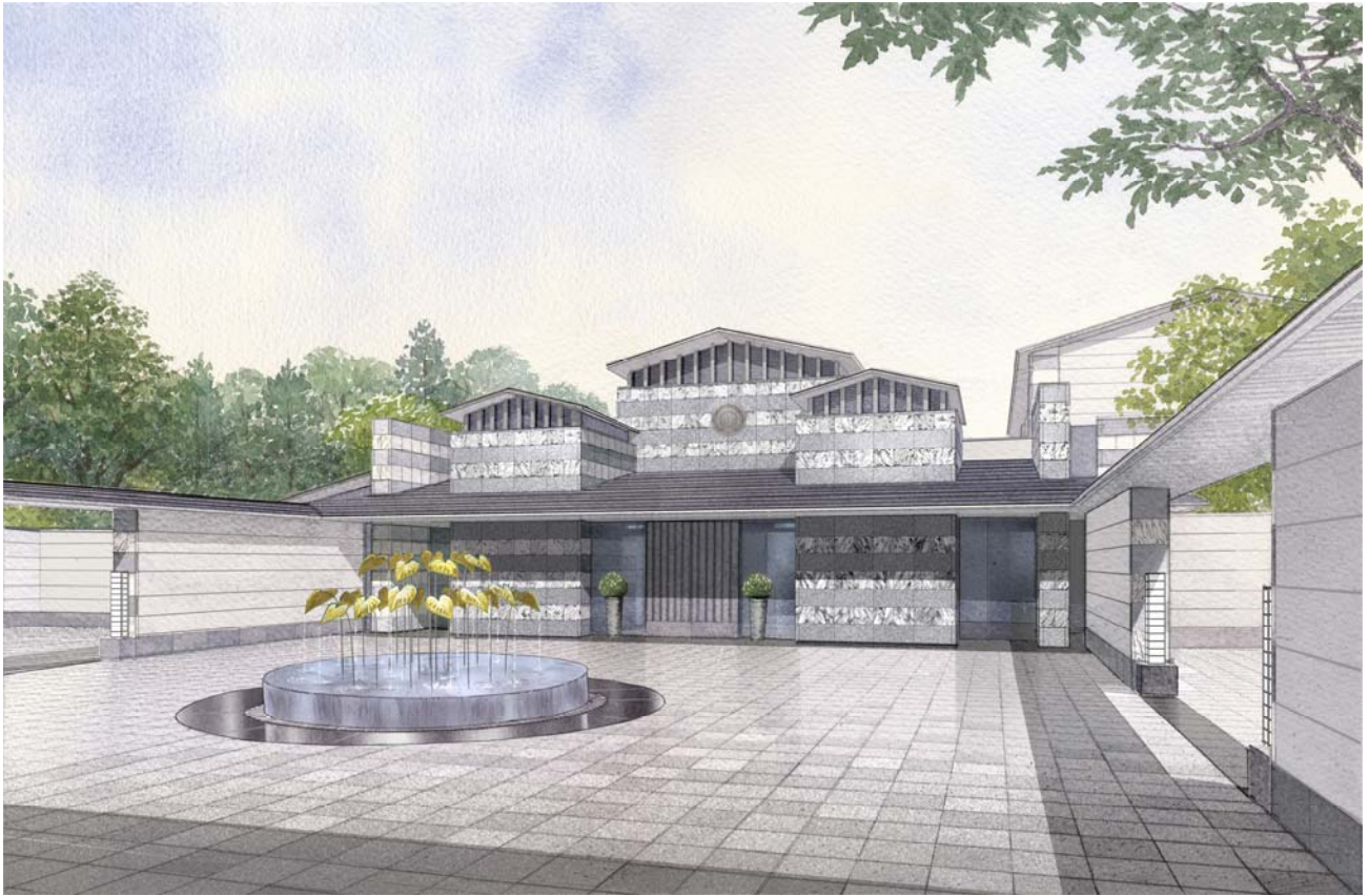
エクシブ軽井沢 サンクチュアリ・ヴィラ ムセオ 車寄せ