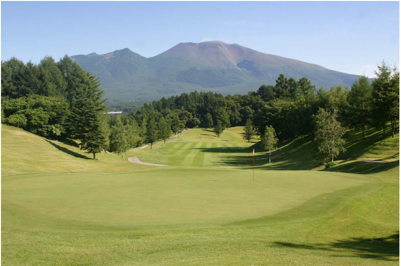
グランディ軽井沢ゴルフクラブ 9番ホールと浅間山