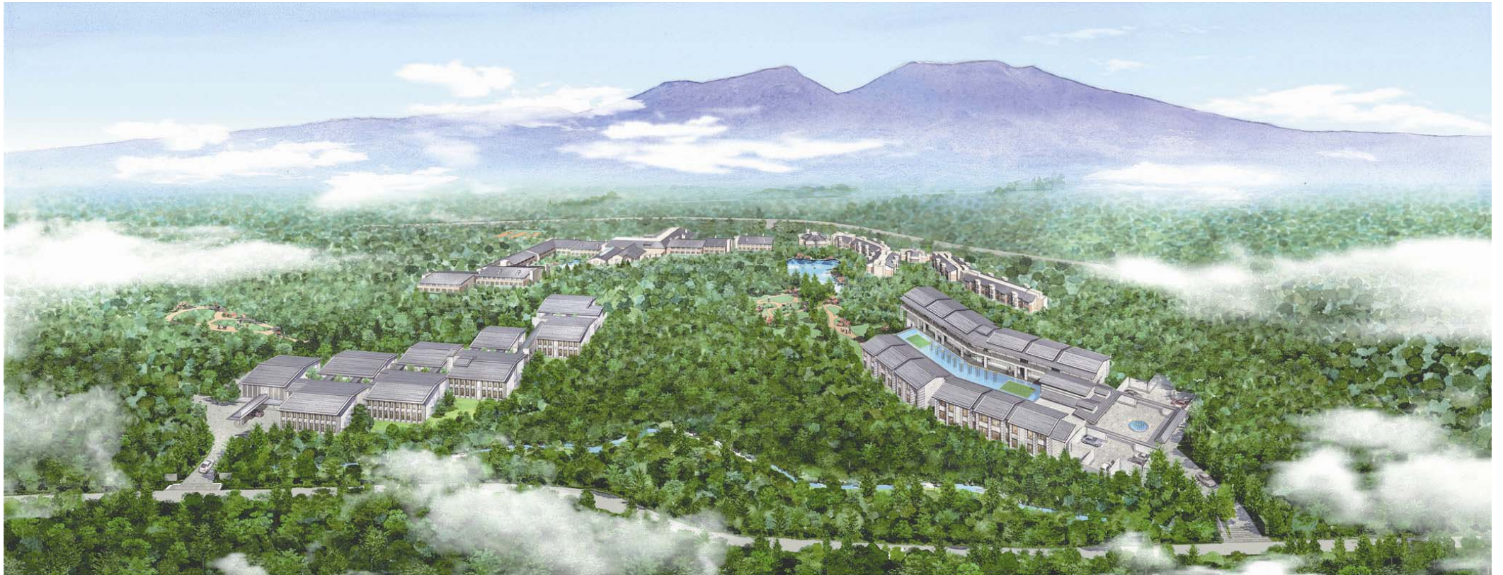
グランドエクシブ軽井沢 ゴルフ&スパリゾートの全景イメージ