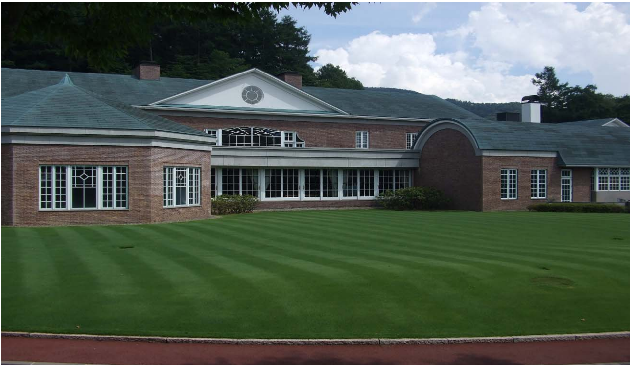
グランディ軽井沢ゴルフクラブ クラブハウス