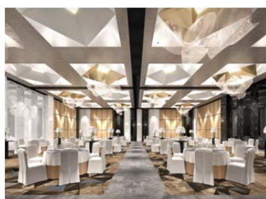
グランドボールルーム