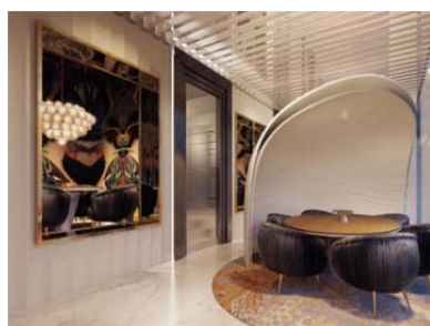
イタリア料理レストラン