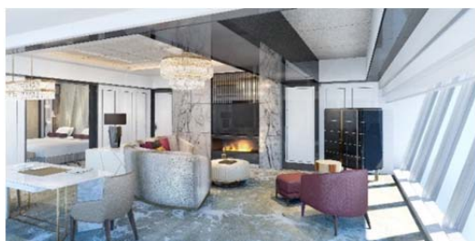
客室:ザ・カハラ スイート