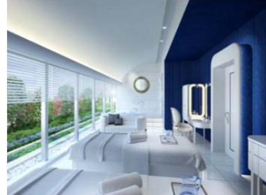
トリートメントサロン