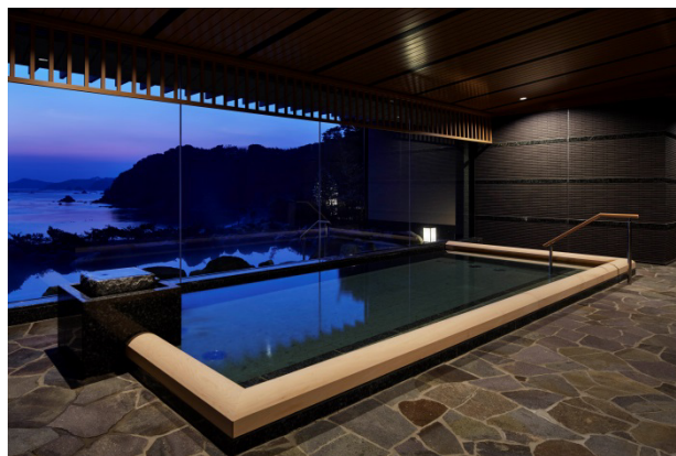
美肌効果のある泉質が魅力の天然温泉