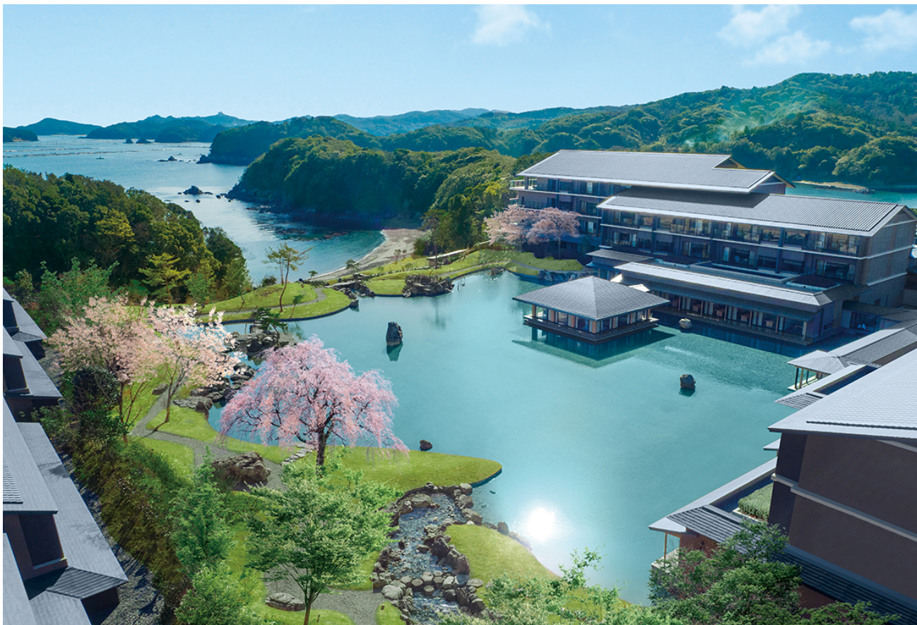
建物と庭の調和がとれて一体に感じられる「庭屋一如」を表現した施設