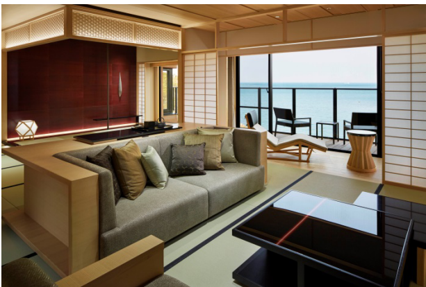
日本の伝統美を現代的にアレンジした客室