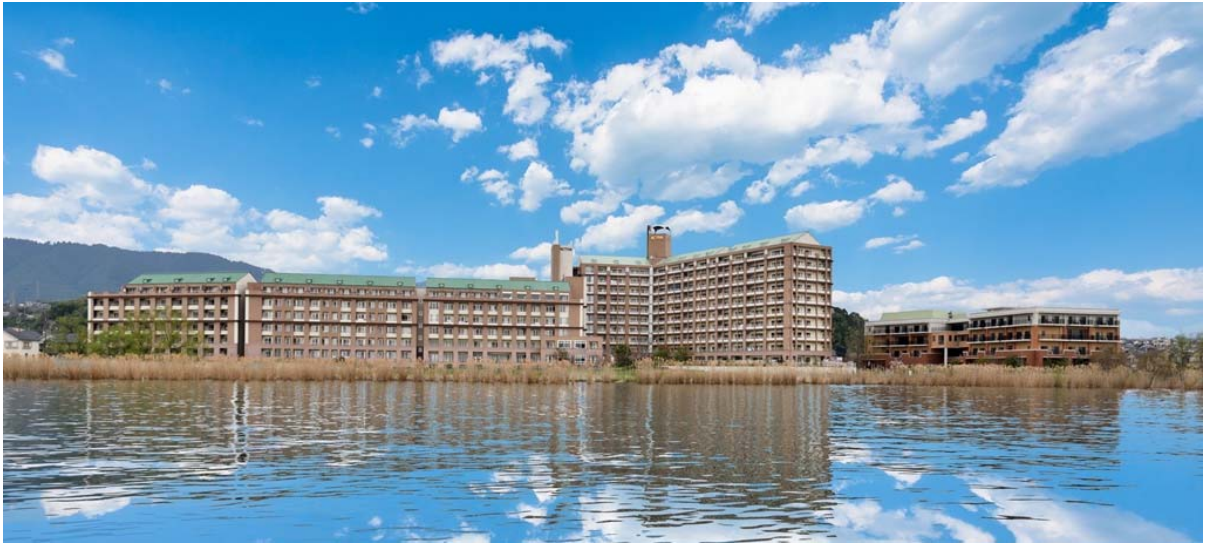
全体外観 琵琶湖側から