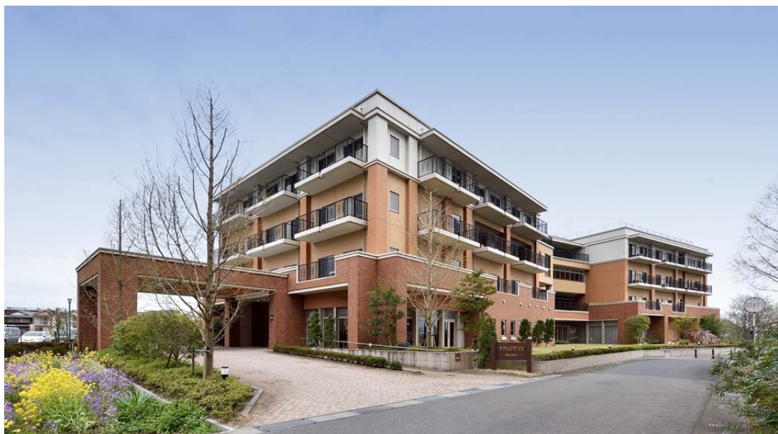
ケアレジデンス(介護棟)