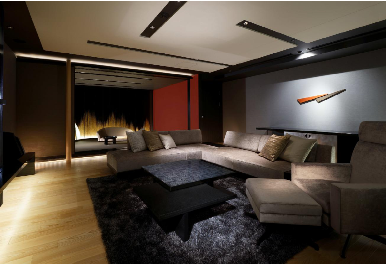
スーパースイートルーム（客室Sタイプ）