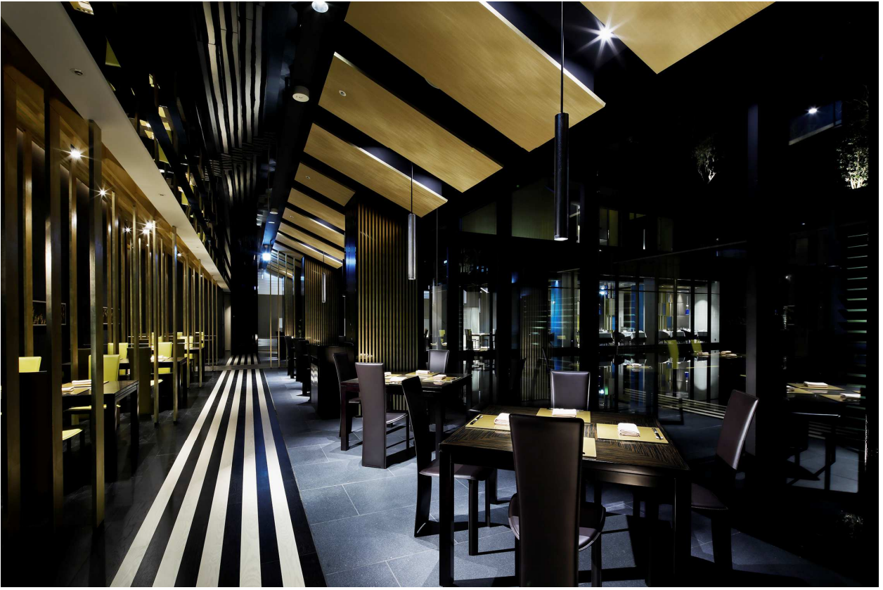
日本料理レストラン