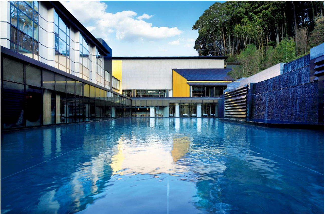
水庭・パブリック棟・客室2号棟