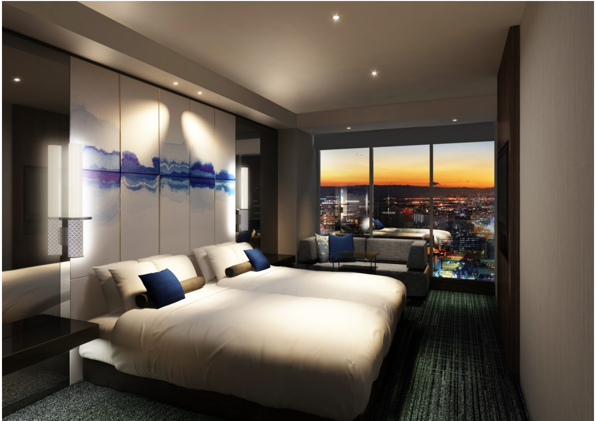
【客室】ツインルーム