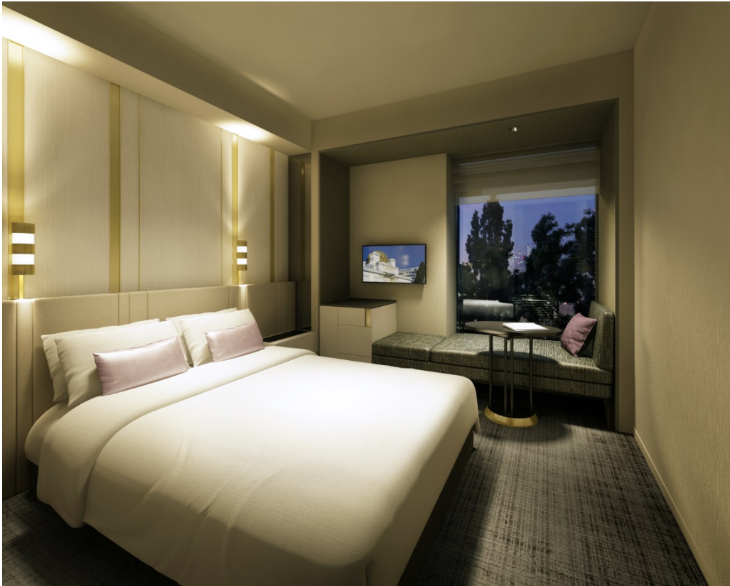
【客室】ダブルルーム