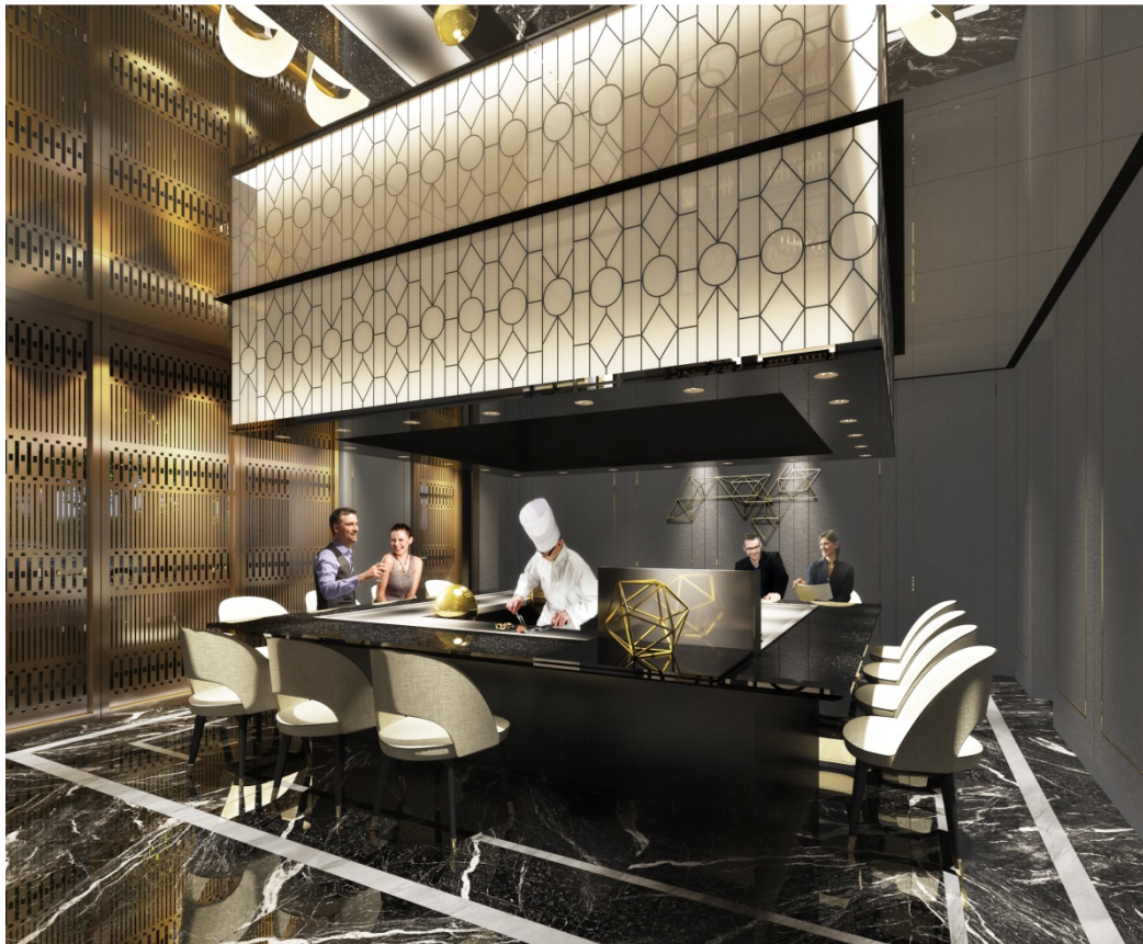
【鉄板焼レストラン】