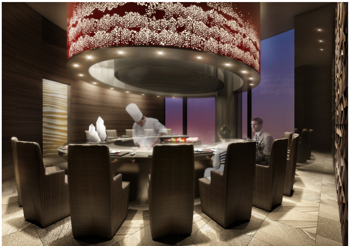
【鉄板焼レストラン】