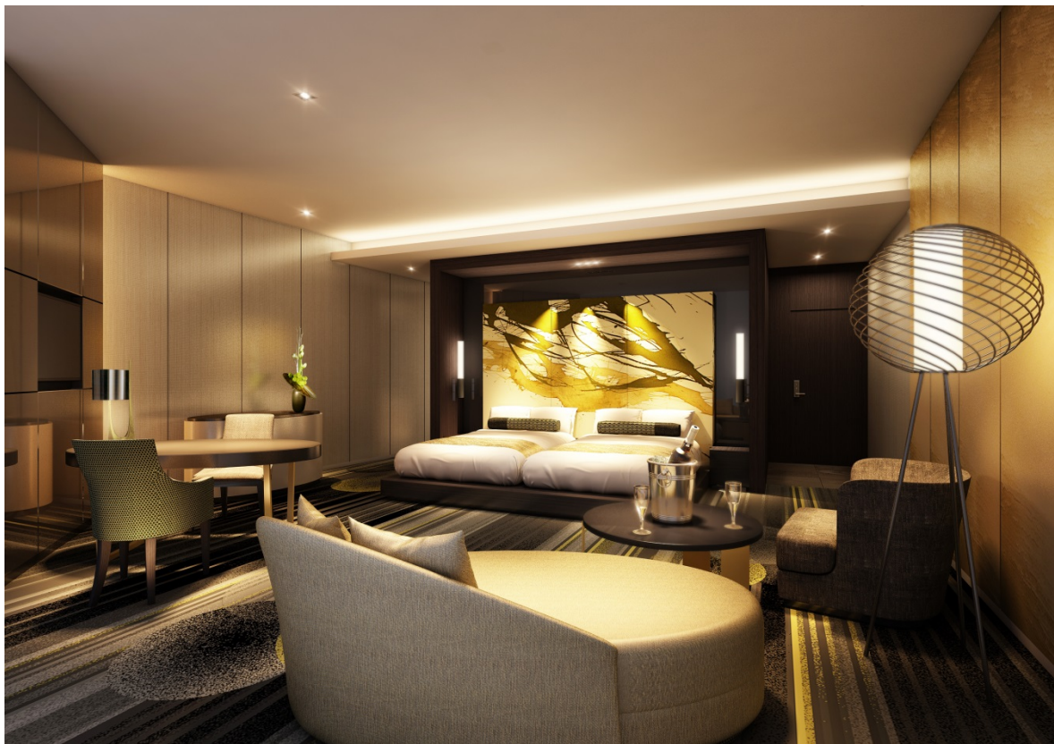
【客室】スイートルーム

「熊本都市計画 桜町地区第一種市街地再開発事業」は、熊本城ホールをはじめ、バスターミナル、商業施設等の複合施設を建設するものです。当社はホテル部分を担います。