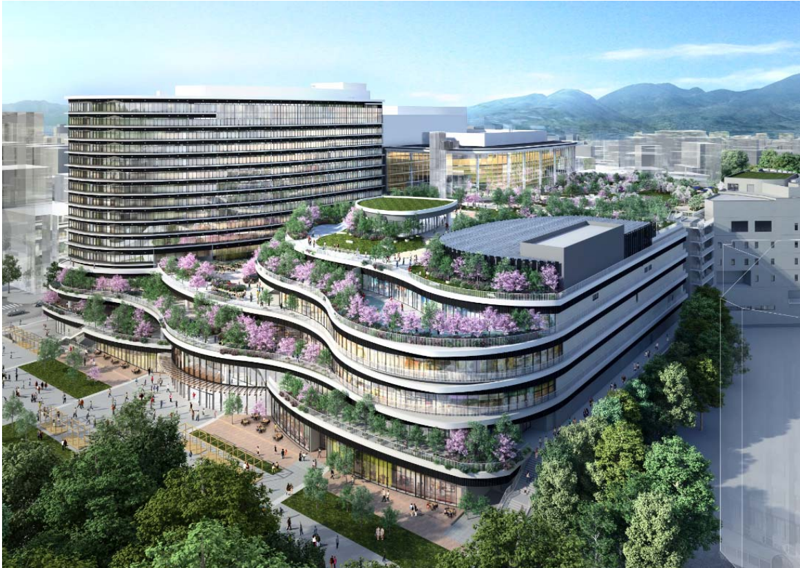
【外観】熊本都市計画 桜町地区第一種市街地再開発事業 イメージ図

「熊本都市計画 桜町地区第一種市街地再開発事業」は、熊本城ホールをはじめ、バスターミナル、商業施設等の複合施設を建設するものです。当社はホテル部分を担います。