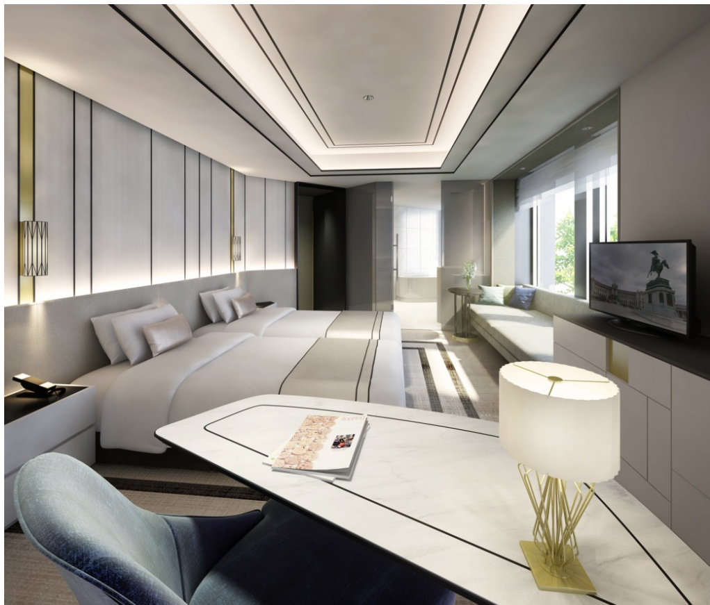
【客室】DX ツインルーム