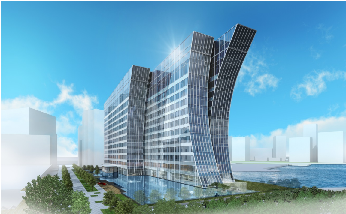
波が寄せては返す「汀（みぎわ）」をイメージした外観