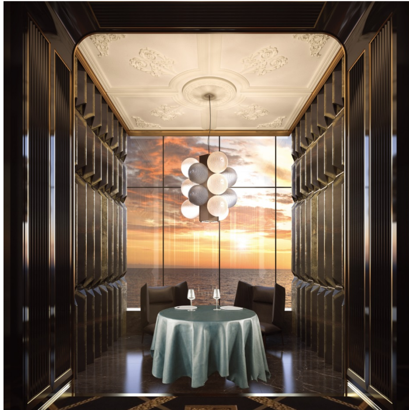
完全個室で異国情緒溢れる装飾の「中国料理レストラン」