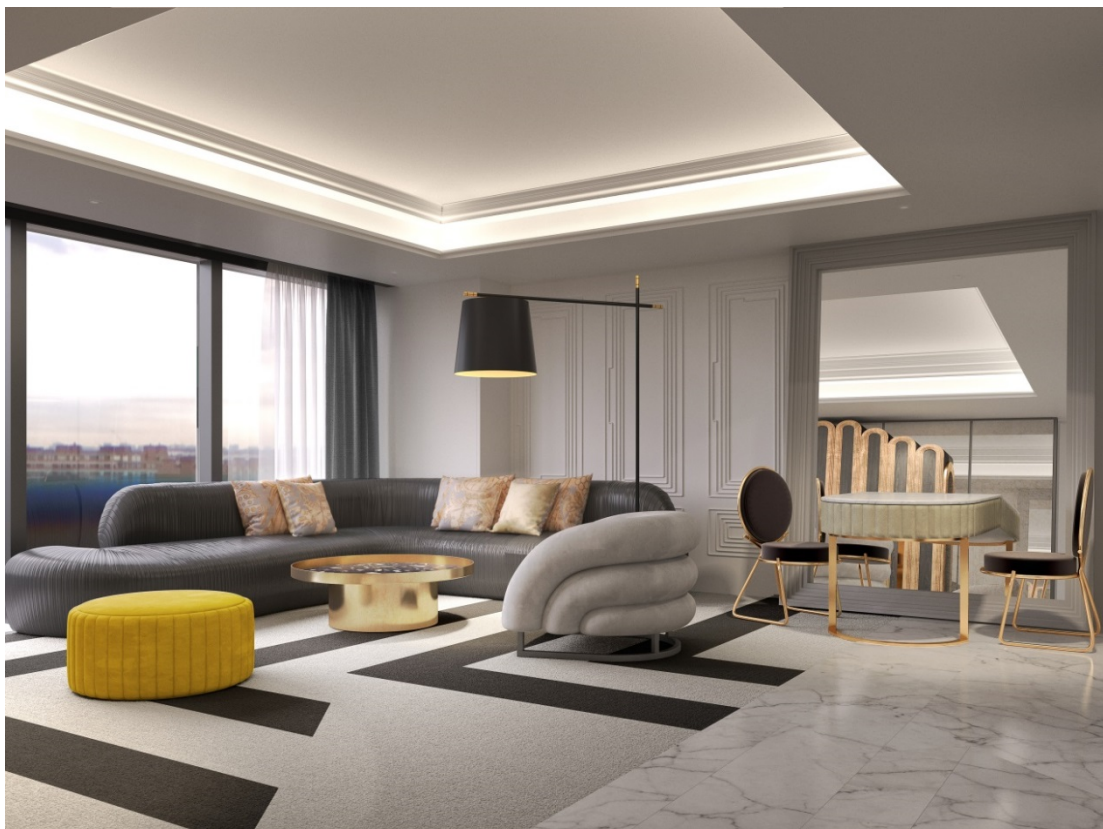
白と黒を基調にゴールドとイエローが華やかな「ロイヤルスイートルーム」