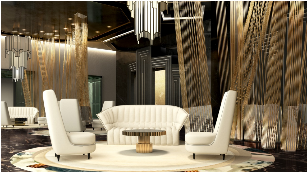
艶やかな黒壁にゴールドが美しい「スカイロビー」