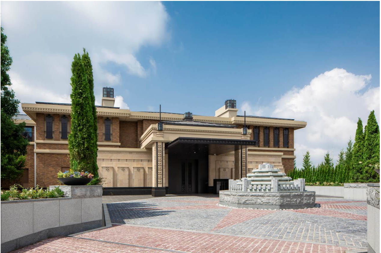
「車寄せ」より「センター棟」をのぞむ