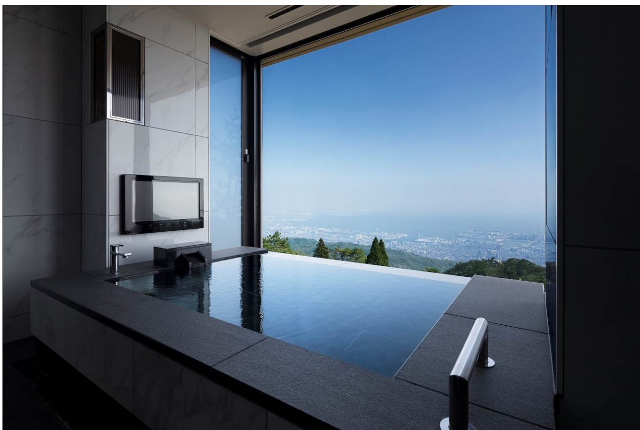
全客室で温泉を楽しむことができる