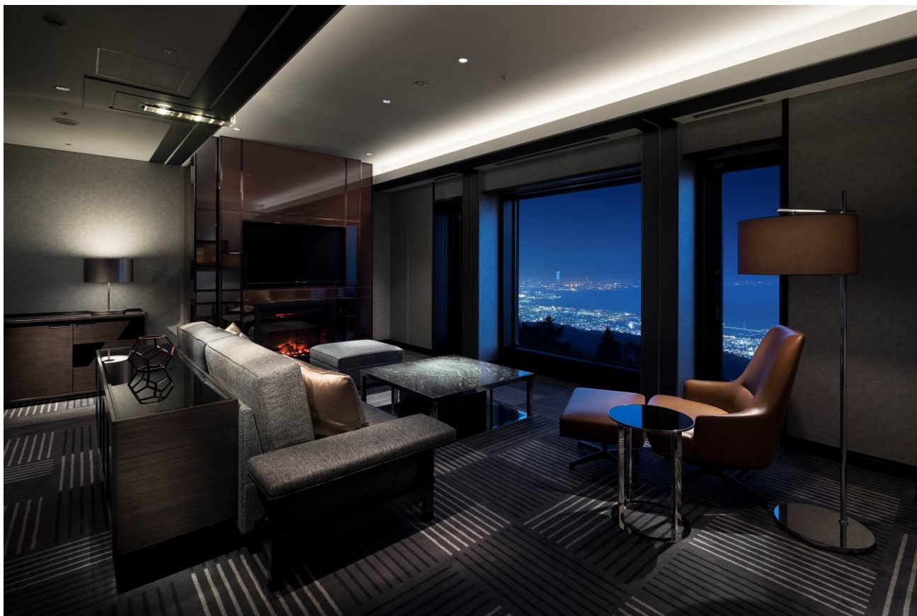
暖炉にハーフミラーを用いるなどスタイリッシュなタイプの客室