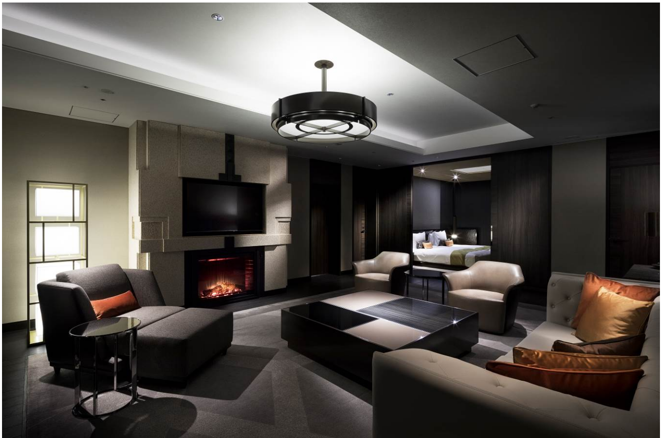
あたたかみのある色彩を基調にデザインしたタイプの客室