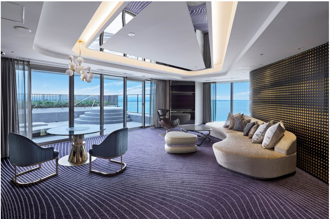
ロイヤルスイート（バルコニー付き）