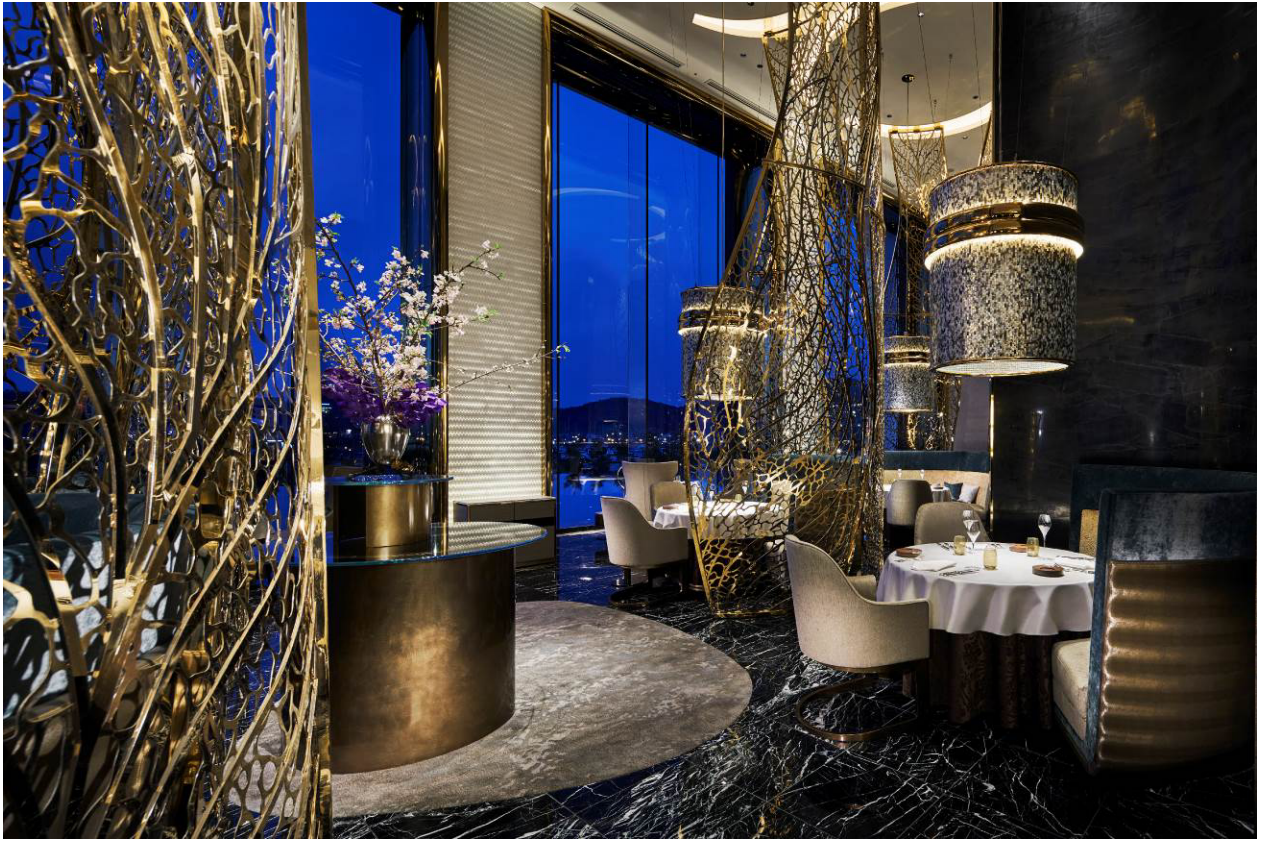
メインダイニング