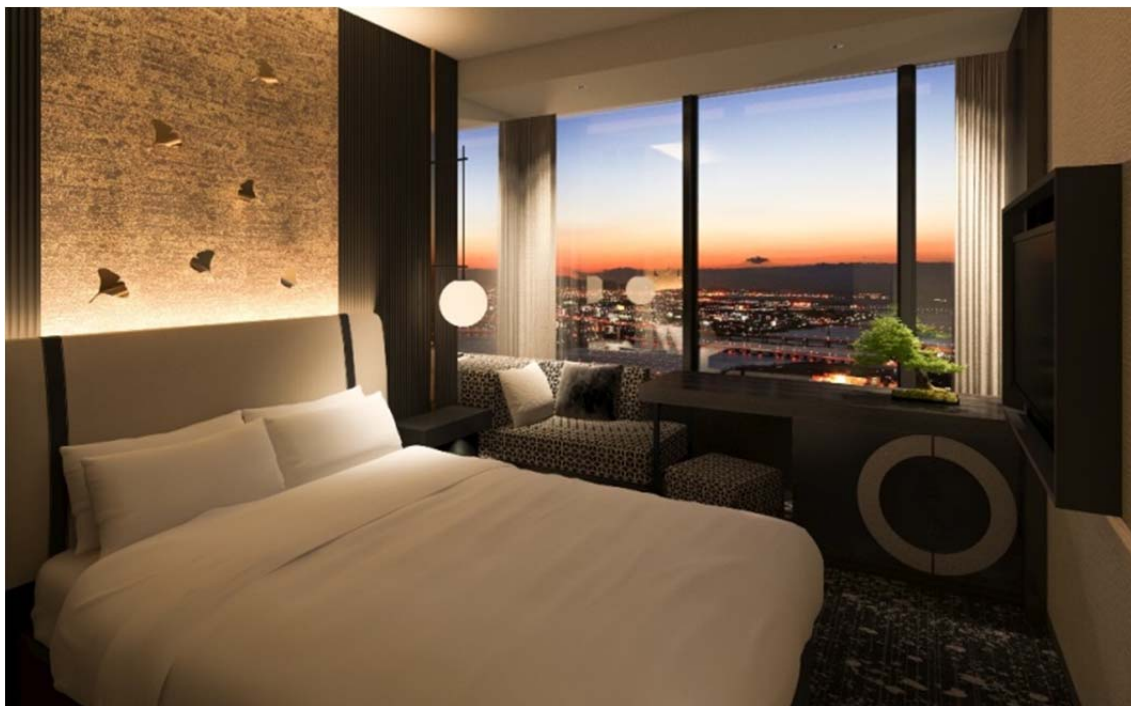
【客室 スタンダードダブル】広さ 16.9～17.8 m 2 料金 22,000 円 (消費税込)

ゲストルームはすべてノンスモーキング、シャワーブース付バスルームで快適性と利便性を追求した空間。寛ぎの滞在をご提供します。