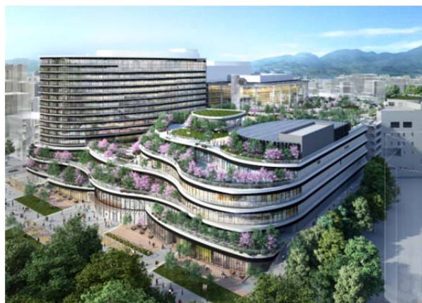
【外観】熊本都市計画

「ホテルトラスティ プレミア 熊本」は、日本最大級のバスターミナルに加え、テナント数 148 店舗の商業施設・シネマコンプレックス・保育施設・ブライダル施設・オフィス・ホール・会議場・展示場などから構成される「熊本都市計画 桜町地区第一種市街地再開発事業」内に開設されます。観光やビジネス・文化・交流の中心地としての宿泊需要に応え、上質なおもてなしを提供します。