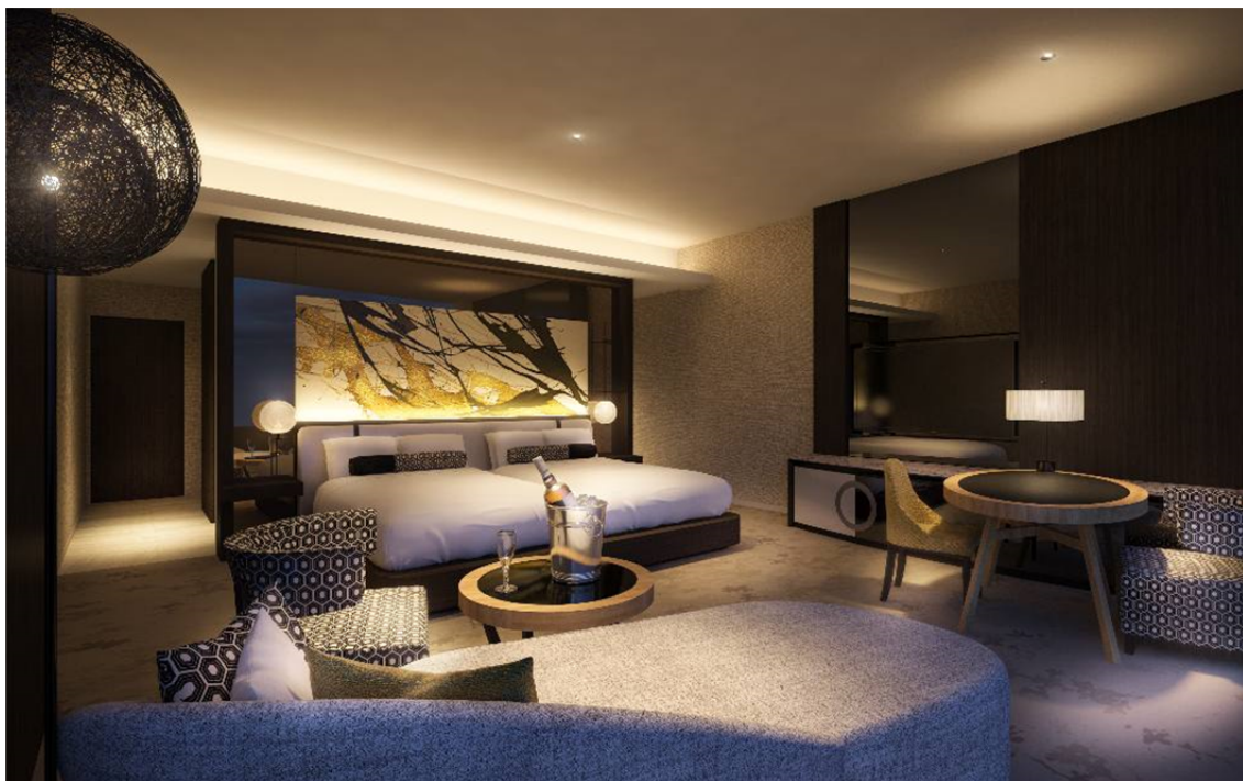
【客室 スイート】広さ 52.7.m 2 料金 80,000 円 (消費税込)