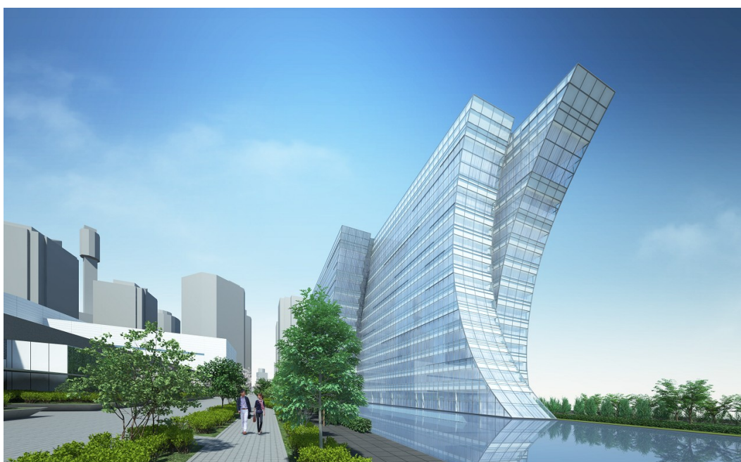
建設予定のホテル (歩道右側の建物) を望む (計画イメージ)