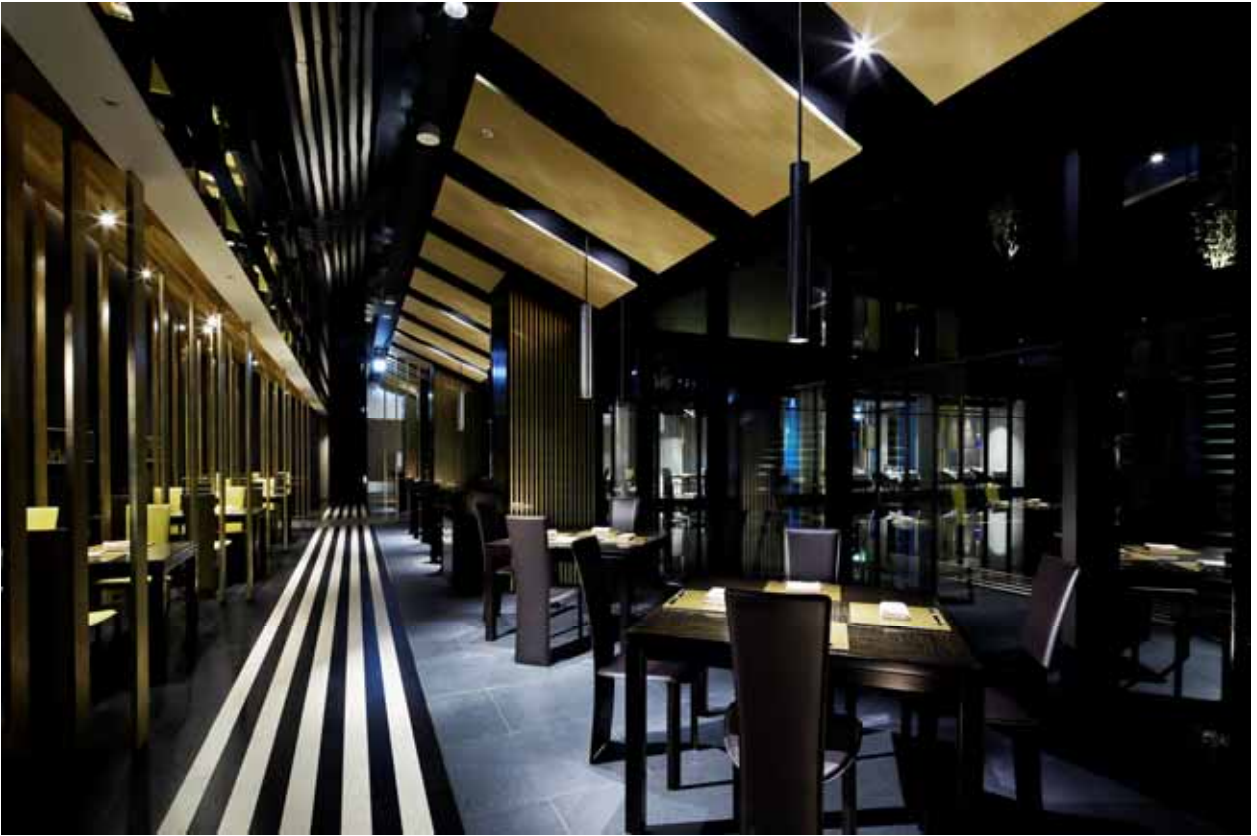
日本料理レストラン