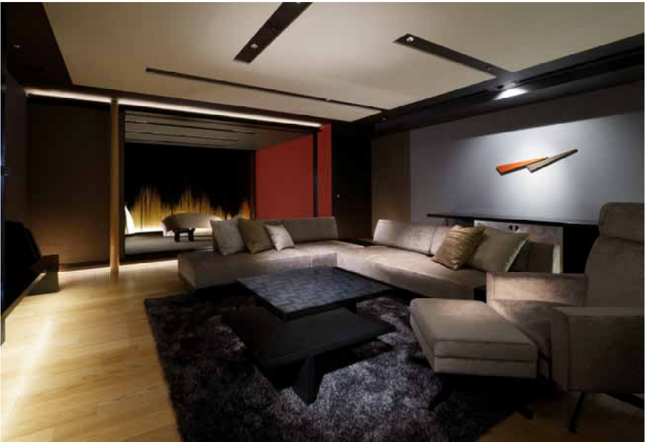
スーパースイートルーム（客室Sタイプ）