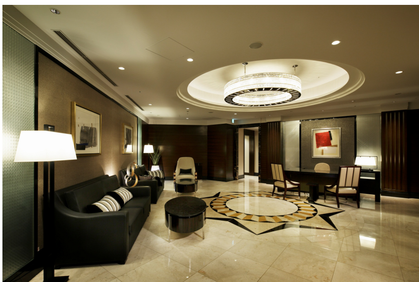
ハイメディック東京ベイ画像センター ロビー

所在地 : 東京都江東区有明3丁目1番15号 ホテルトラスティ東京ベイサイド地下1階 延床面積 : 約500m 2 導入設備 : PET/MRI、乳房用PET、超音波診断装置 オープン : 2015年4月27日