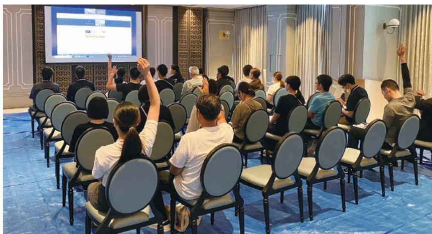
ホテル内ボールルームで開催された採用説明会の様子です。多くの地元の方々にご参加いただきました。

いただきました。行政にはホテル敷地前の道路の舗装や、湖岸や鴨川河岸の整備をしていただいたほか、当社グループが重視する「地産地消」を実現できるよう、地元のさまざまな生産者様もご紹介いただきました。また雇用面でも現地採用によるスタッフの確保に向け、さまざまなサポートをいただきました。それら地元採用のスタッフには、地域にコネクションを持つ人も多く、地域への説明会や広報活動にも協力が得られました。